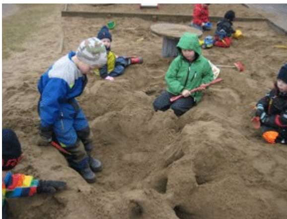
Rikskriminalen och Stockholmspolisen i full gång i sandlådan!